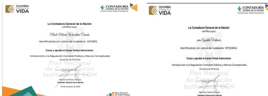
Ilustración 04. Certificaciones CGN